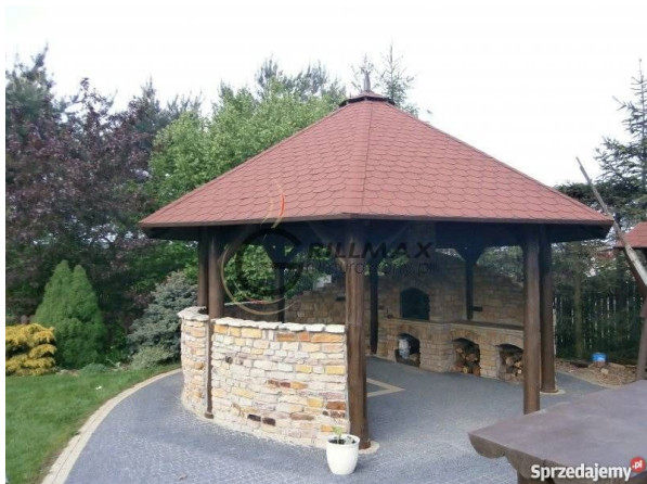
Sprzedajemy 10 zał. 1