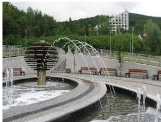
Tężnia solankowa w Czeladzi